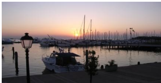
Abendstimmung in Sottomarina mit Blick Richtung Chioggia