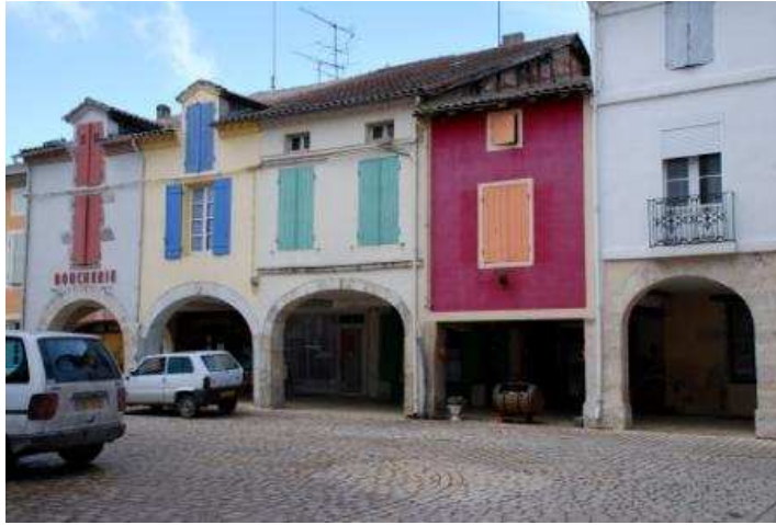
Am Marktplatz von Damazan