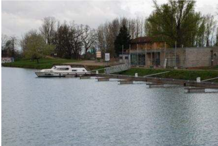
Einsam – im Hafen von Montauban