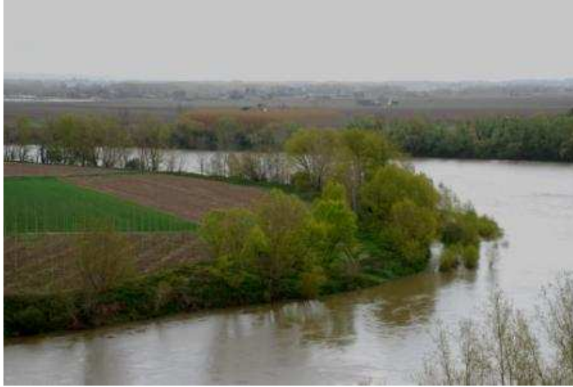
Blick auf die Garonne

Alles in allem ein schöner Urlaub, auch wenn wir in diese Gegend nicht mehr ganz so früh im Jahr fahren würden. Zwar hatten wir den Kanal in weiten Strecken für uns alleine, aber viele Einrichtungen waren noch geschlossen, inklusive vieler Schleusen, und es war schade, dass wir die Flüsse nicht befahren konnten. Auch das Wetter ist wohl im Sommer besser, auch wenn wir dank der gut funktionierenden Heizung nicht allzu oft frieren mussten.