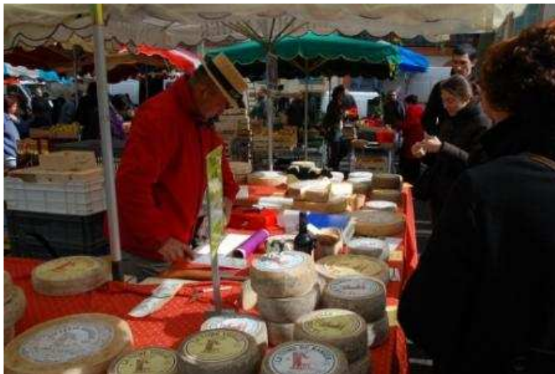
Wochenmarkt in Montauban

Morgens holten wir die am Vortag wegen des Wetters gestrichene Stadtbesichtigung von Montauban nach. Es ist ein Stück zu laufen bis zur Altstadt, dafür sahen wir den recht eindrucksvollen Tarn, der Hochwasser hatte und über die Wehre strömte. Auf dem Wochenmarkt kauften wir uns den ersten Spargel des Jahres. Die Schleuse vom Kanal zum Tarn ist zwar außer Betrieb, wird aber gerade wieder hergerichtet – vermutlich kann man sie irgendwann in nächster Zeit wieder befahren. Nachmittags machten wir uns auf den Rückweg nach Montech, durch die neun Schleusen – wenn man es auf dieser Etappe nicht lernt, dann wohl gar nicht mehr. Meine Hände waren mittlerweile von den nassen Leinen recht wund – Handschuhe wären nicht schlecht gewesen! Auf jeden Fall verzichteten wir für den Tag auf weitere Schleusen und verbrachten eine weitere Nacht im Hafen von Montech.