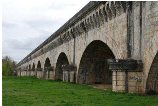
Die Kanalbrücke vor Agen – einmal beim Drüberfahren, einmal von unten