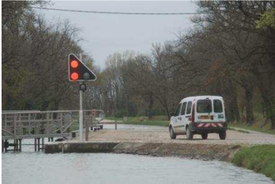
Ein häufiger Anblick – die Schleuse funktioniert nicht, aber die vnf ist schon da.