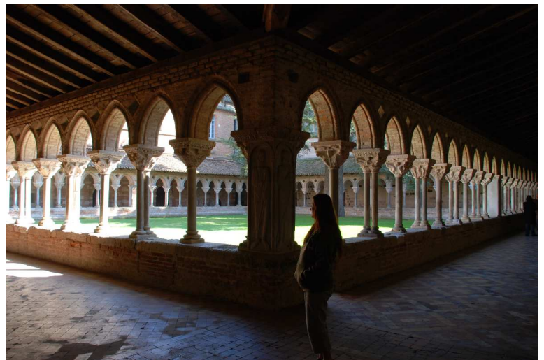
Eingang und Innenhof - Kloster von Moissac