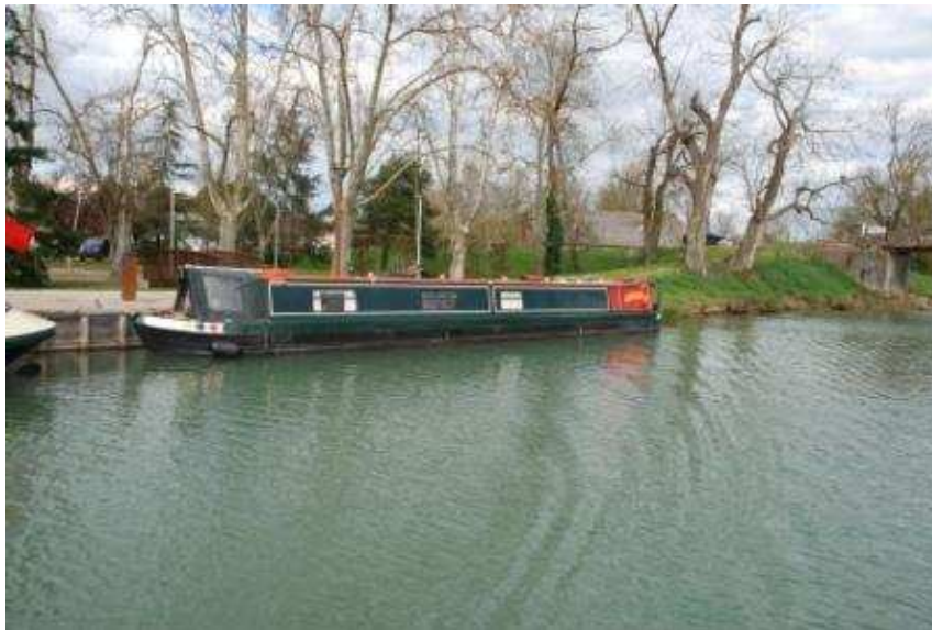
Das englische Narrowboat Kinsarvik – lange unser Begleiter

Bei bitterer Kälte – 2 Grad Celsius und Wind – machten wir uns auf den Rückweg. Als erstes standen die 5 Schleusen vor Montech an, wobei mir schon nach den ersten beiden fast die Finger abfroren. Ich erledigte zwischen den Schleusen den Abwasch, wodurch ich meine Hände immer wieder im Spülwasser aufwärmen konnte. Nach einer kurzen Mittagspause in Castelsarrasin trafen wir an der nächsten Schleuse auf ein englisches Narrowboat, das uns über die nächsten Tage begleiten sollte. Die Eigner waren auf dem Weg nach Meilhan, wo sie eine Narrowboat – Vermietung neu eröffnen wollten. Es war uns zwar nicht ganz klar, warum man in Frankreich ein Narrowboat mieten sollte – der Kanal ist doch breit genug für andere Boote – aber wahrscheinlich richtet sich das Angebot hauptsächlich an Engländer, die diesen Bootstyp von zu Hause kennen. Man sah jedenfalls den Profi – der Mann an der Pinne war komplett ver mummt, mit Skimütze und dicken Handschuhen. Zusammen befuhren wir die nächsten Schleusen bis Moissac, wo wir für die Nacht festmachten. Hier mussten wir auch zum ersten Mal Liegegebühr berappen – 7 €, wofür wir allerdings auch einen Gutschein erhielten, der uns in einigen Restaurants der Umgebung zu einem Aperitif berechtigt hätte. Auch erfuhren wir hier die Wettervorhersage für die nächsten Tage – genauso wie heute, nur mit Regen!