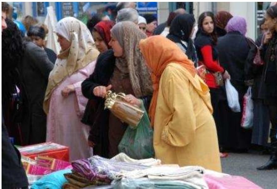
Markt in Agen